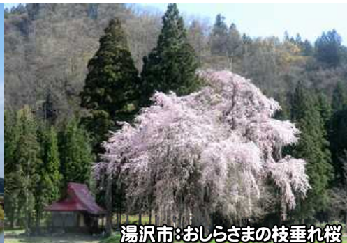
湯沢市:おしろさまの枝垂れ桜