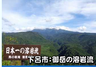
日本一の溶岩流 鳥の脱走 御岳 下呂市:御岳の溶岩流