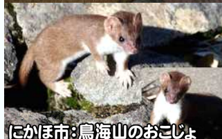
にかほ市:鳥海山のおこじよ