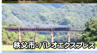
秩父市:パレオエクスプレス