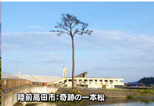
陸前高田市:奇跡の一本松