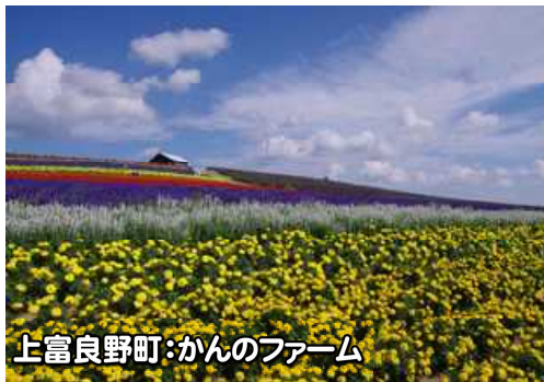
上富良野町:かんのファーム