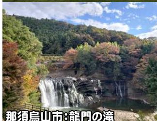
那須烏山市:龍門の滝