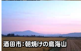
酒田市:朝焼けの鳥海山