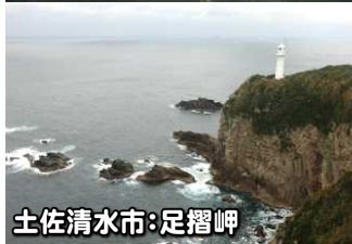
土佐清水市:足摺岬