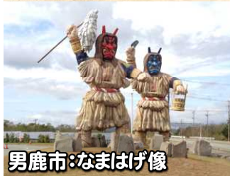
男鹿市:なまはげ像